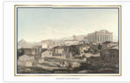
WEST FRONT OF THE PARTHENON CÔTÉ OUEST DU PARTHÉNON WESTFASSENDE DES PARTHENON LATO OVEST DEL PARTENONE ЗАПАДНЫЙ ФАСАД ПАРФЕНОΝΑ ΔΥΤΙΚΗ ΠΛΕΥΡΑ ΤΟΥ ΠΑΡΘΕΝΩΝΑ

DIGITAL SCALED COPY OF THE ORIGINAL ΨΗΦΙΑΚΟ ΑΚΡΙΒΕΣ ΑΝΤΙΓΡΑΦΟ ΥΠΟ ΚΑΙΜΑΚΑ