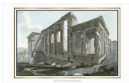
SOUTH WEST VIEW OF THE ERECHTHEION VUE DE L'ÉRECHTHEION DEPUIS LE SUD-OUEST SÜDWESTANSICHT DES ERECHTHEION VEDUTA DELL'ERETTEO DA SUD-OVEST ВИД НА ЭРЕХТЕЙОН С ЮГО-ЗАПАДА ΝΟΤΙΟΔΥΤΙΚΗ ΑΠΟΨΗ ΤΟΥ ΕΡΕΧΘΕΙΟΥ

Αναπαραγωγές των αυθεντικών χαρακτηριστικών που έφτιαξαν από το 1801 ως το 1806 από τους Edward Dodwell και Simone Pomardi, απεικονίζοντας έξοχες απόψεις μνημείων όπως ήταν πριν από δύο αιώνες. Ο Dodwell, ένας ιρλανδός ζωγράφος, περιηγητής και συγγραφέας περί την Αρχαιολογία, ταξίδεψε στην Ελλάδα από το 1801 ως το 1806. Το 1804 γνώρισε τον Pomardi και ταξίδεψαν μαζί στην Ελλάδα. Και οι δύο μας προσέφεραν πολλές πληροφορίες και εικόνες της Ελλάδας των αρχών του 19ου αιώνα, πριν από την μεγάλη λεηλασία των αρχαιολογικών θησαυρών που ακολούθησε.