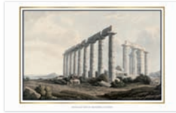
SOUTH EAST VIEW OF THE TEMPLE AT SUNIUM VUE SUD-EST DU TEMPLE AU CAP SOUNION SÜDOSTANSICHT DES TEMPELS VON SUNIUM VEDUTA SUD-EST DEL TEMPIO A CAPO SUNIO ВИД НА ХРАМ МЫСА СУНИУМ С ЮГО-ВОСТОКА ΝΟΤΙΟΑΝΑΤΟΛΙΚΗ ΑΠΟΨΗ ΤΟΥ ΝΑΟΥ ΤΟΥ ΣΟΥΝΙΟΥ