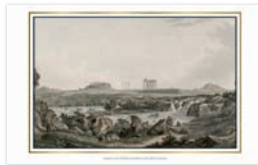
TEMPLE OF JUPITER OLYMPIOS AND RIVER ILISSOS LE TEMPLE DE ZEUS OLYMPIEN ET LE FLEUVE ILISSOS TEMPEL DES JUPITER OLYMPIOS UND DER FLUSS ILISSOS TEMPIO DI ZEUS OLIMPIO E FIUME ILISSOS ХРАМ ЗЕВСА ОЛИМПИЙСКОГО И РЕКА ИЛИСС ΝΑΟΣ ΟΛΥΜΠΙΟΥ ΔΙΟΣ ΚΑΙ ΠΟΤΑΜΟΣ ΙΛΙΣΣΟΣ