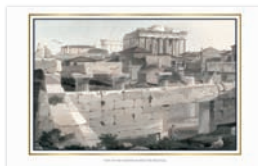
VIEW OF THE PARTHENON FROM THE PROPYLEA VUE DU PATHÉNON DEPUIS LES PROPYLÉES BLICK AUF DEN PARTHENON VON DEN PROPYLÄEN VEDUTA DEL PARTENONE DAI PROPILEI ВИД НА ПАРФЕНОН ОТ ПРОПИЛЕЙ ΑΠΟΨΗ ΤΟΥ ΠΑΡΘΕΝΩΝΑ ΑΠΟ ΤΑ ΠΡΟΠΥΛΑΙΑ