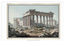
SOUTH EAST VIEW OF THE PARTHENON VUE DU PATHÉNON DEPUIS LE SUD-EST SÜDOSTANSICHT DES PARTHENON VEDUTA DEL PARTENONE DA SUD-EST ВИД НА ПАРФЕНОН С ЮГО-ВОСТОКА ΝΟΤΙΟΑΝΑΤΟΛΙΚΗ ΑΠΟΨΗ ΤΟΥ ΠΑΡΘΕΝΩΝΑ